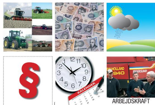
B: Kommentarkort – forhold