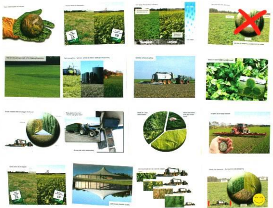
A: Faglige anbefalinger